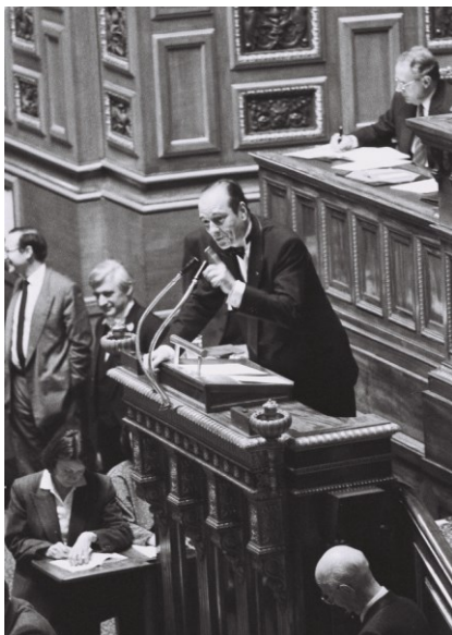
Photographie de Jacques CHIRAC, Premier ministre, le 15 avril 1987