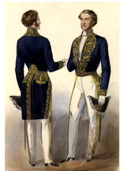
Sénateurs du Second Empire en tenue, Archives du Sénat, 71S 344.

Pour faire suite à la mise en place du vote électronique, venez découvrir dans les vitrines de l'antichambre de la buvette des parlementaires ainsi que dans celles de la Bibliothèque, des documents et des objets inédits, sur les coulisses des comptes rendus et des votes en séance publique. Vous pourrez notamment y voir le boîtier de vote électrique de Jacques CHIRAC lorsqu'il siégeait à l'Assemblée nationale en qualité de député.