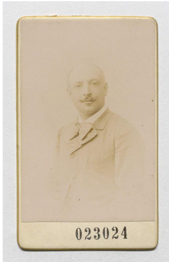
Portrait présumé de Charles Grandjean, Archives du Sénat, Fonds Grandjean, 23024

Nommé à l'École Française de Rome, dont il est membre du 1 er octobre 1881 au 30 septembre 1883, il y entre aux côtés du byzantiniste Charles Diehl et y rencontrera notamment l'antiquisant Camille Jullian et Pierre de Nolhac 2 , le futur conservateur du musée de Versailles 3 . Il travaille sur Benoît XI Boccasini, éclaircissant « plusieurs points encore obscurs » 4 de son pontificat puis édite, après son séjour en Italie, dans la Bibliothèque des Écoles françaises d'Athènes et de Rome , les Registres de ce pape 5 parus entre 1883 et 1905 ainsi qu'un article où, le premier, il détermine la date de la mort du pape Boccasini.