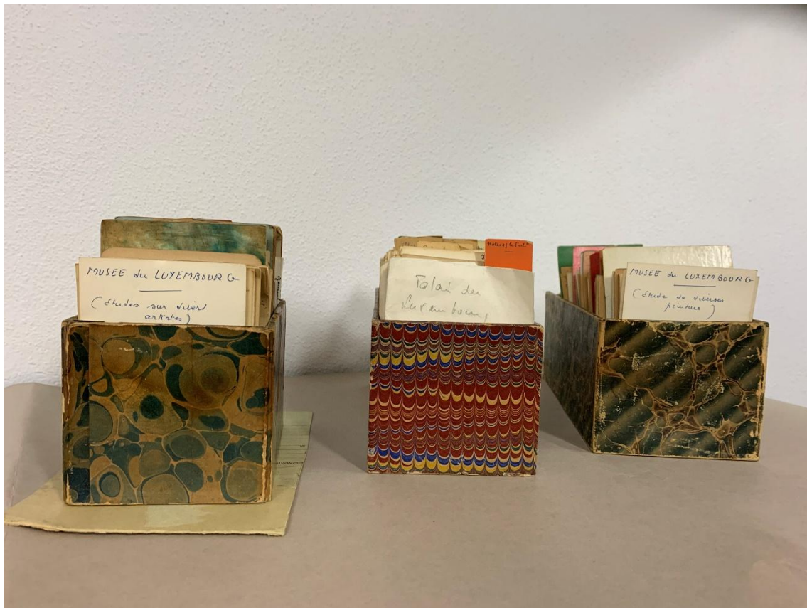
DEUX EXEMPLES DE BOÎTES CONTENANT DES FICHES ÉTABLIES PAR CH. GRANDJEAN